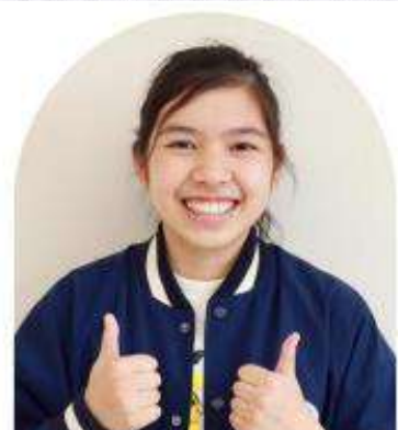
สาขานากาโนะ NAGANO Campus

ในปีนี้นักเรียนที่ได้รับการคัดเลือกจาก MANABI ก็ได้รับทุนจากรัฐบาลญี่ปุ่นในโครงการส่งเสริมนักเรียนต่างชาติด้วยเช่นกัน โดยจะได้รับทุนจำนวน 360,000 เยน ต่อปี